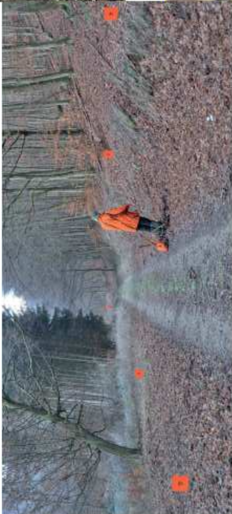
Réalisé par Jean-Luc RIES, président de la commission sécurité