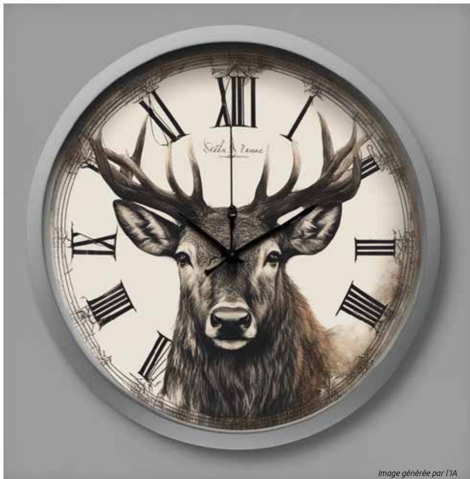
Image générée par l'IA

Maintenant que faire, quelles réponses apporter au « choc de régulation » voulu par l'Etat et à appliquer par l'ONF ? Sur un plan local, venir en masse aux messes de Saint Hubert programmées à partir d'octobre mais en restant à l'extérieur des églises ou sur le parvis de la cathédrale de Strasbourg aurait été, à mon sens, une bonne occasion de sensibiliser