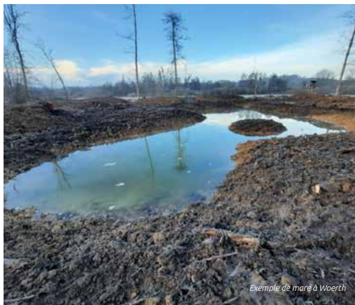
Exemple de mare à Woerth